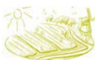
Zorg voor water en land