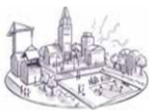
Krachtige kernen en linten

Daarnaast wordt in de Regionale Energiestrategie (hierna: RES) samengewerkt met de regio aan een regionale bijdrage voor de opwekking van duurzame energie.