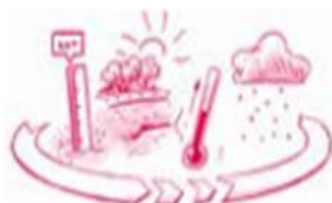
Klaar voor transitie