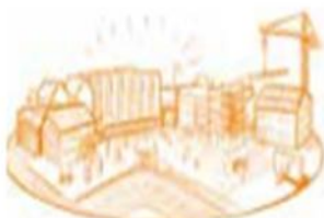
Werken aan ondernemen