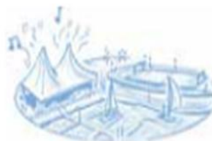
Ontspanning binnen handbereik