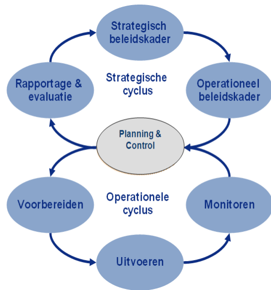
Figuur 2 - BIG 8

Op grond van artikel 7.2 van het Besluit omgevingsrecht (Bor) stelt het bestuursorgaan dat belast is met toezicht en handhaving, zijnde het college van burgemeester en wethouders respectievelijk het college van gedeputeerde staten, handhavingsbeleid vast waarin zij gemotiveerd aangeeft welke doelen zij zich stelt bij de handhaving en welke taken het daartoe zal uitvoeren. Het handhavingsbeleid valt op te splitsen in een strategisch beleidskader (voor Omgevingsdienst IJmond Uitvoeringskader genoemd) en een operationeel beleidskader. Met het Uitvoeringskader worden, op grond van een probleemanalyse, de prioriteiten en doelstellingen geformuleerd waar Omgevingsdienst IJmond zich de komende jaren op richt bij de uitvoering van haar taken.