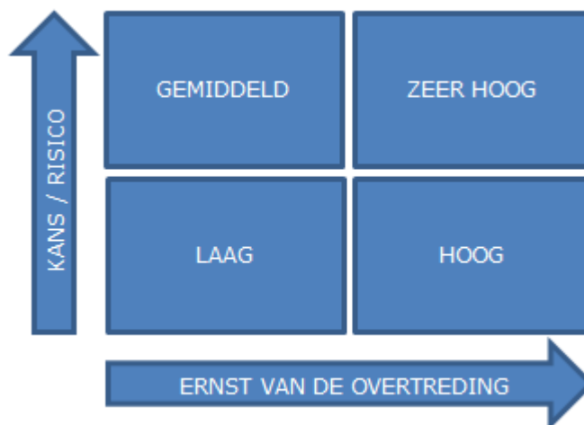
Figuur 4 - Achtergrond risicomatrix

De prioriteitenstelling is gebaseerd op een inschatting van het risico op negatieve effecten bij overtreding van de verschillende handhavingsthema's. Om die risico's te kunnen inschatten is een risicoanalyse gemaakt met betrekking tot de verschillende inrichtingbranches. De risicoanalyse brengt het risico in beeld dat aan elk van de handhavingsthema's is verbonden. Risico is daarbij gedefinieerd als het negatief effect maal de kans dat die zich voordoet, of risico = negatief effect x kans.