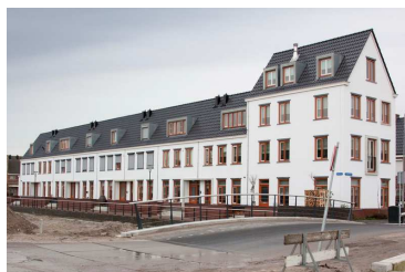
Eindwoningen bij rijwoningen zijn verbijzonderd