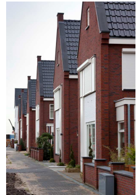
Kozijnen en bewegende delen zijn in principe van hout