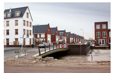
De hoofdzakelijk grondgebonden woningen zijn georiënteerd op de openbare ruimte en ontsluitingsstraten