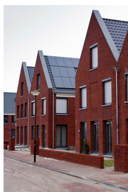
Baksteen in bruin-roodtinten is beeldbepalend