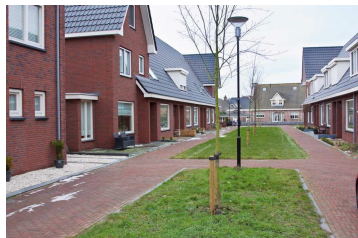
Grondgebonden woningen die niet zijn aangemerkt als verbijzondering hebben een kap