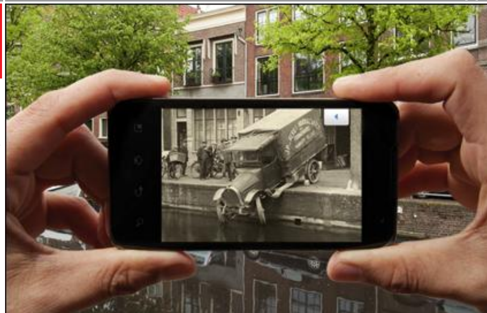
Meeliften bij interessante en relevante initiatieven