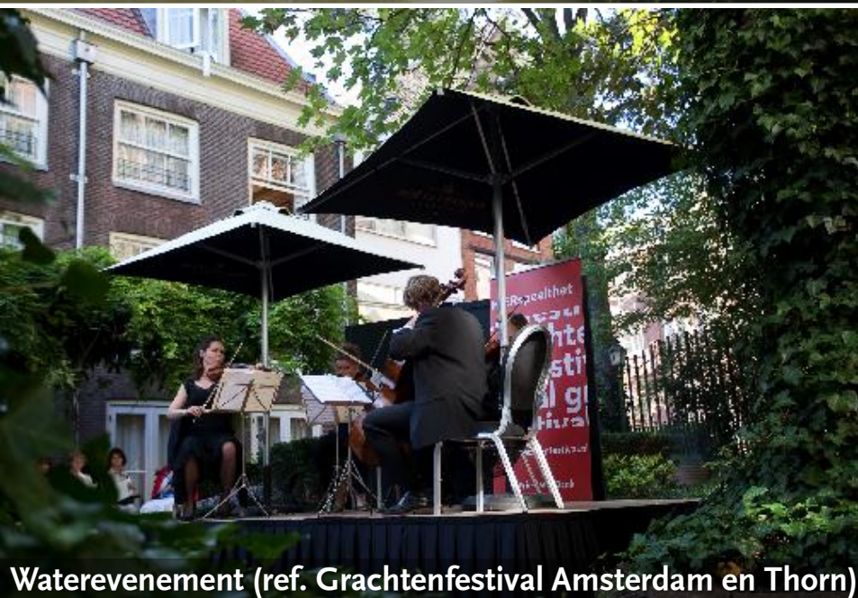
Waterevenement (ref. Grachtenfestival Amsterdam en Thorn)