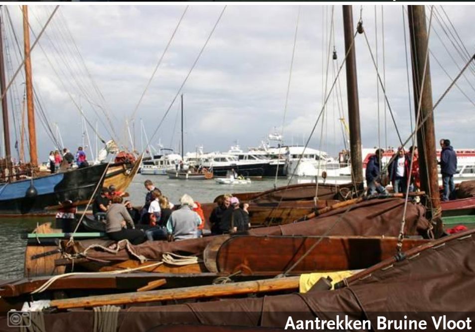
Aantrekken Bruine Vloot