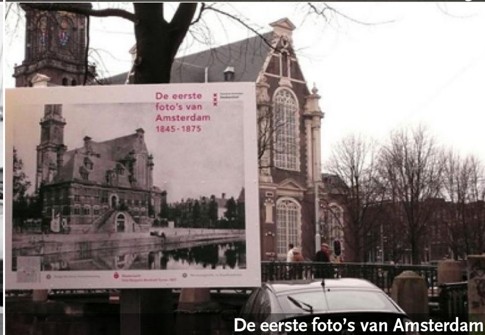
De eerste foto's van Amsterdam