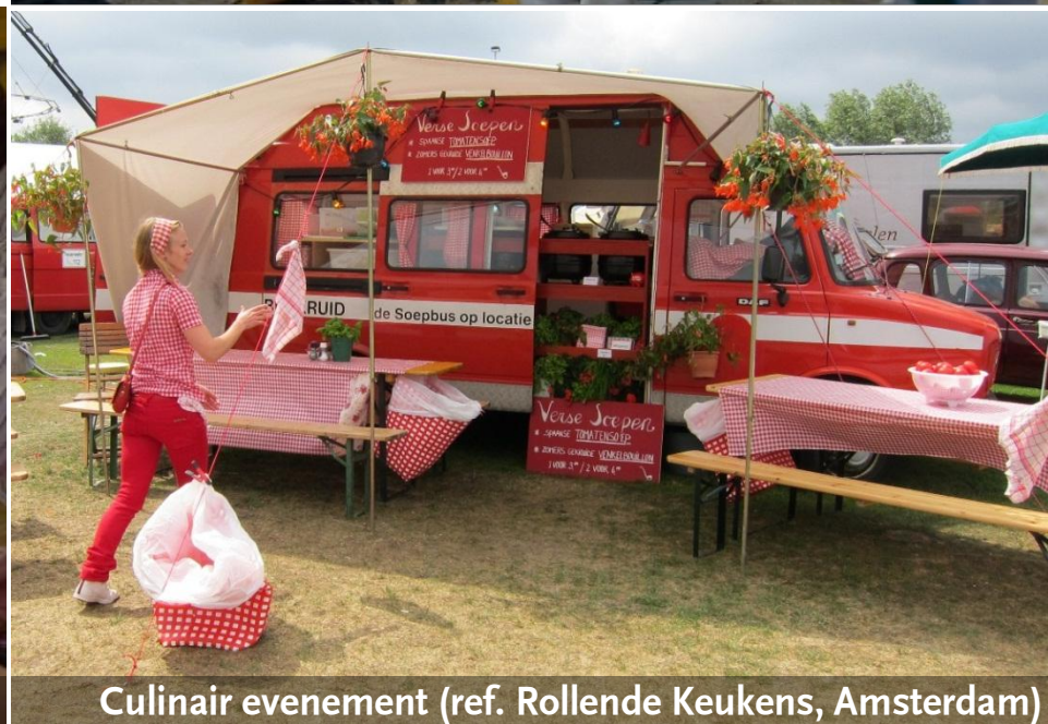
Culinair evenement (ref. Rollende Keukens, Amsterdam)