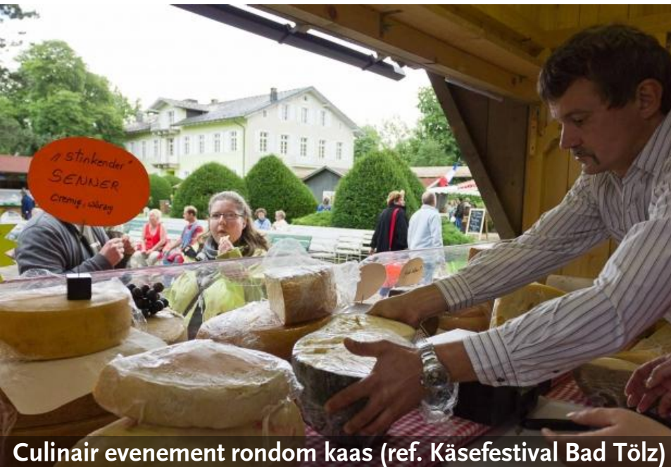
Culinair evenement rondom kaas (ref. Käsefestival Bad Tölz)