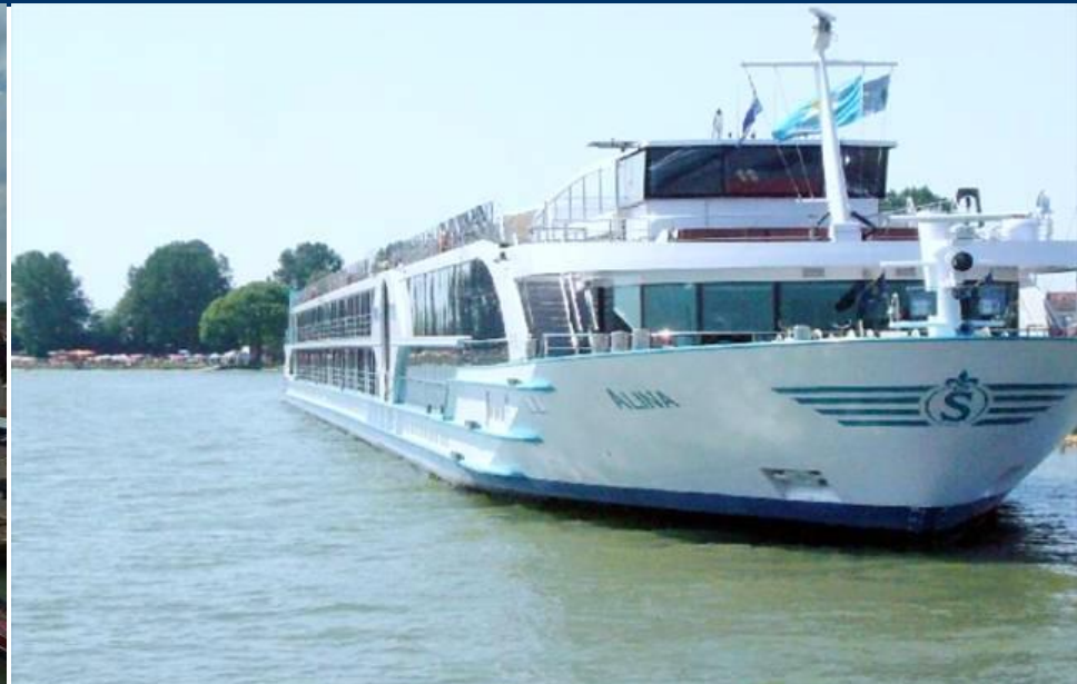
Steiger riviercruiseschepen aanpassen