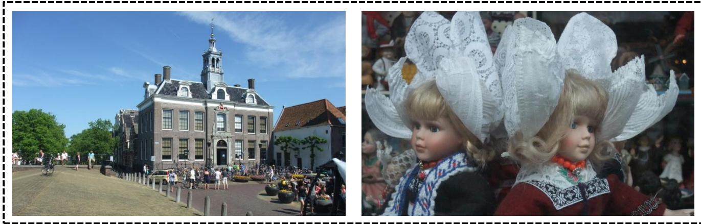
Collectieve marketing: één organisatie, twee verschillende producten

www.laagholland.com/nl/over-laag-holland/highlights.html