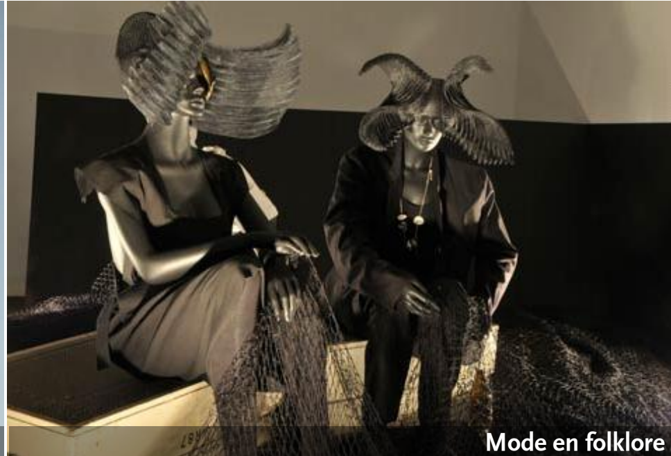
Mode en folklore