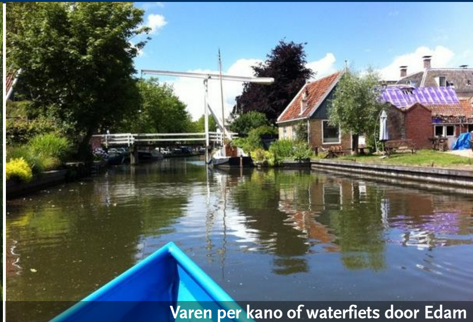
Varen per kano of waterfiets door Edam