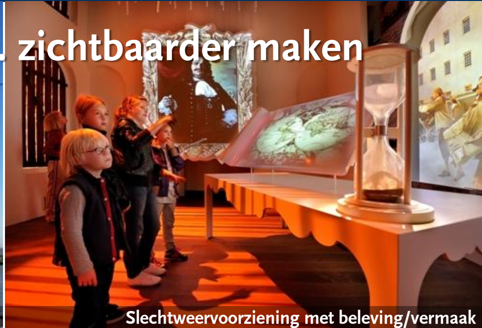
Slechtweervoorziening met beleving/vermaak