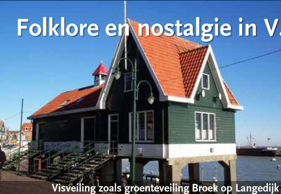
Visveiling zoals groenteveiling Broek op Langedijk