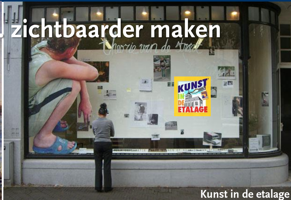
Kunst in de etalage