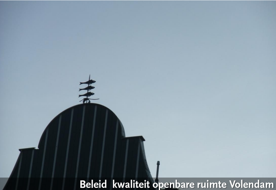
Beleid kwaliteit openbare ruimte Volendam