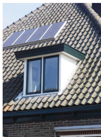
zonnecollectoren zijn aan voor- en zijkant niet wenselijk