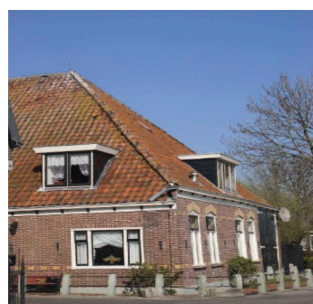
een dakkapel mag bij voorkeur alleen op de voorgevel worden geplaatst