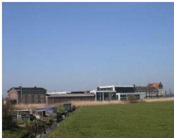
de horizontale aaneenschakeling van hoofd- en bijgebouwen is niet in lijn met de karakteristieke verkaveling van het landelijk gebied