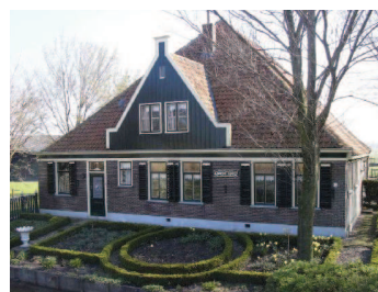
de hoofdvorm, één lage begane-grondlaag plus pyramidevormig dak, geldt als uitgangspunt