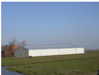
een situatie waarbij het materiaal en de kleur niet voldoen aan de gebiedsspecifieke eigenschappen