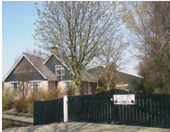
een situatie waarbij geen duidelijk onderscheid is gemaakt in massa tussen hoofdgebouw en bijgebouw