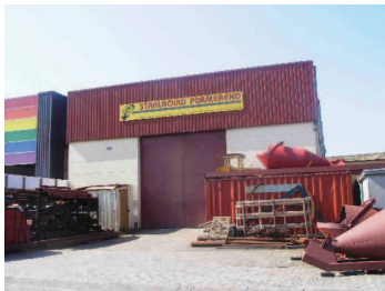
de vormgeving van de voorgevel moet bijdragen aan de kwaliteit van het gebied tussen gebouw en straat: "de voortuin"