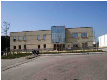
bij de representatieve locaties is een geleding van de voorgevel gewenst