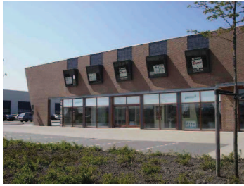
de publieke of representatieve functies zijn gericht op de straat