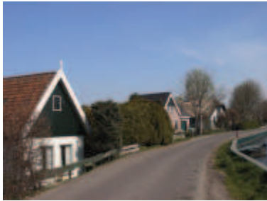
de kleinste en bepalende eenheid van het gebied omvat één enkel vrijstaand pand met een individueel karakter