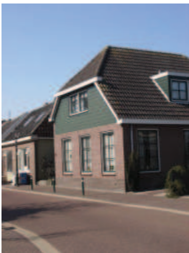
een wolfseind is bij verbouw of renovatie niet toegestaan

zicht van kracht. Het is echter wel de wens van de gemeente het gebied rond de Hervormde Kerk aan het Westeinde en Raadhuisstraat te behandelen als beeldbepalend voor het dorpsgezicht. Ondanks de afwezigheid van de status Beschermd Dorpsgezicht, staat er in dit gebied wel (solitaire) bebouwing die als rijksmonument is aangemerkt of als beeldbepalend voor het dorpsbeeld.