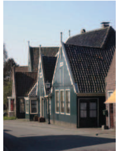
het kleur- en materiaalgebruik dient volgens traditioneel gebruik te zijn