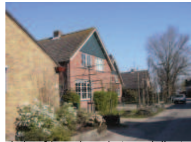
de hoofdgevel van het pand dient aan de hoofdstraat te liggen, en daaraan evenwijdig te lopen