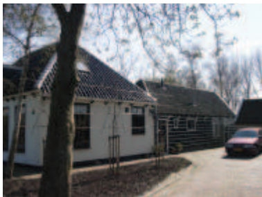
aan- en bijgebouwen dienen te zijn verbonden aan de hoofdmassa en daarmee een architectonisch geheel te zijn