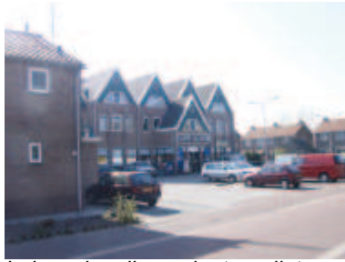
bebouwing die verder terugligt van de rooilijn, waar mogelijk verdient de handhaving van de strakke rooilijnen de voorkeur