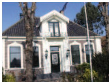
bijzondere aandacht voor de entree van het pand is wenselijk