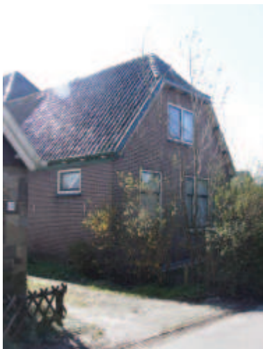
een wolfseind is niet toegestaan bij verbouw of renovatie