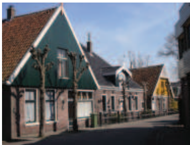
de hoofdgevel van het pand dient aan de hoofdstraat te liggen, en daaraan evenwijdig te lopen